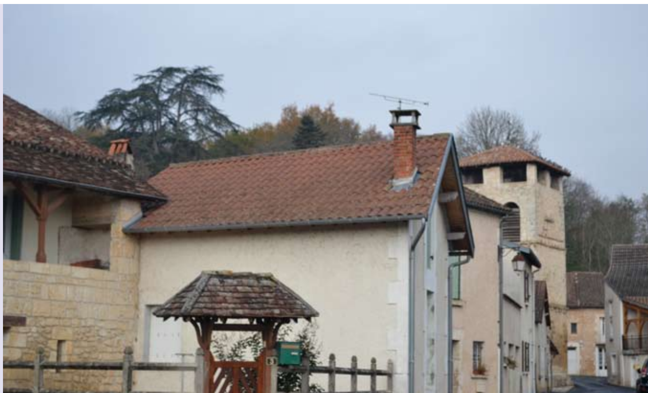
La quiétude à Sarliac-sur-L'Isle