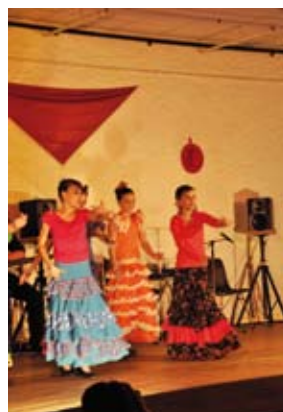
Spectacle Pena Andalouse le 10 mars...