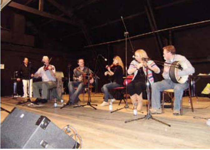
La soirée Saint-Patrick