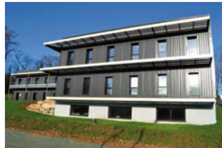
45 personnes travaillent au siège social de CER France Dordogne.