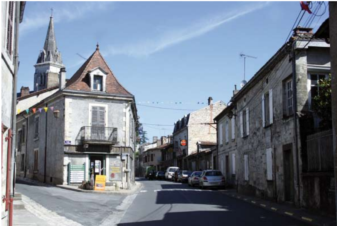
Les premiers dossiers pourront être déposés en septembre mais il faut y penser dès maintenant.

Pour inciter les propriétaires les moins favorisés à réaliser des travaux, le nouveau PIG apportera de nombreuses aides et un dispositif d'accompagnement en matière de logement. Les premiers dossiers pourront être déposés en septembre 2012, mais il faut y penser dès à présent. Depuis 2008, la CAP s'engage en faveur de l'habitat privé pour définir au mieux les enjeux liés à sa réhabilitation et améliorer l'offre sur le territoire intercommunal. Forte de cette dynamique réussie vers les propriétaires bailleurs et les logements conventionnés, la CAP souhaite aller plus loin en s'adressant aux propriétaires occupants à faibles ressources.