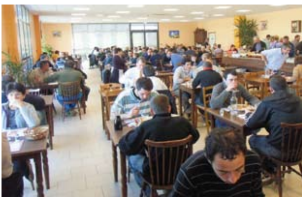
L'Escale, la bonne étape