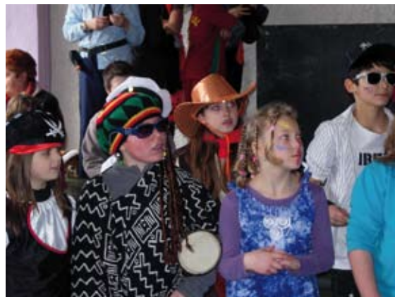
Le 16 mars, le comité des fêtes de Razac organise un carnaval

> Dimanche 5 , Grand bal organisé par l'association Dansons l'Europe. Tel : 05.53.07.82.59