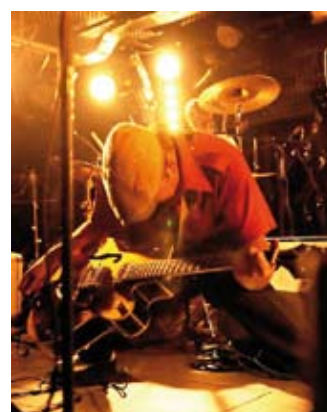
... et Soirée Hot Gang, le 16 mars.