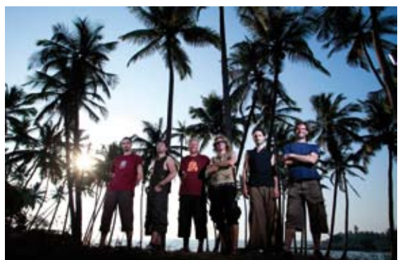
Le groupe Hilight Tribe se produira à Périgueux.

> Jedi 29 mars à 21h : Hilight Tribe et guest. Org : Tin Tam Art / Le Sans Réserve