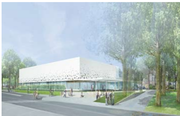
La maquette de la future piscine Bertran de Born