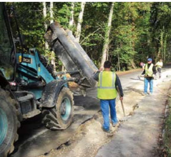
Les travaux vont continuer cette année

Les eaux usées de Coursac sont actuellement transférées vers la station d'épuration de Saltgourde.