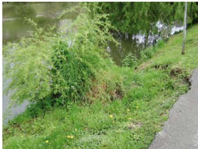
Les berges sous surveillance

Les travaux se poursuivent rue des Près à Périgueux pour palier les risques d'effondrement de la berge, très abîmée dans ce secteur. Sur 650 mètres, de la passerelle Barnabé au Pont des Barris, les pieds de la berge sont recréés, en fonction de l'état d'usure de chaque endroit. De nouveaux végétaux permettant de retenir la berge, seront notamment plantés dans les prochains mois. Quand le site est plus dégradé, il est procédé à des enrochements sous-fluviaux avec une pelle embarquée sur une barge flottante. Pour découvrir les berges sous ce nouveau jour, encore un peu de patience, le terrassement se termine en mars et les plantations se finiront en octobre. Une opération qui s'évalue au final à 500 000€.