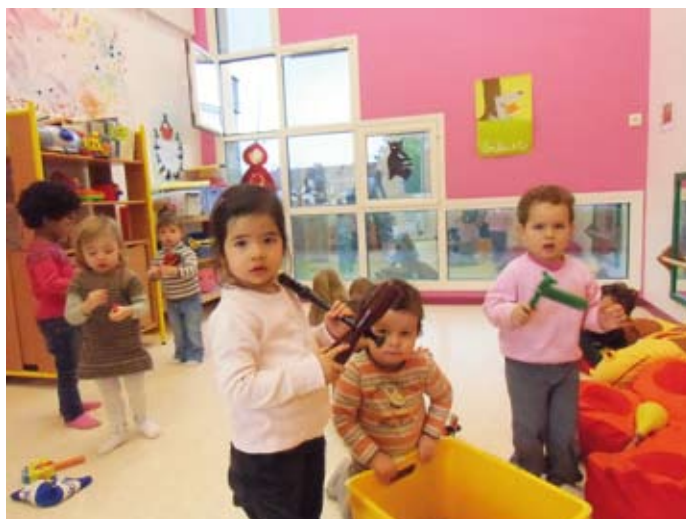
La musique bat son plein

CRÈCHE LES SOURIS VERTES 8 rue des Ecoles 24430 Marsac-sur-l'Isle Tel : 05 53 04 12 12 lessourisvertes@agglo-perigueux.fr Nombre d'enfants accueillis : 20 au maximum âgés de 2 mois à 4 ans. Equipe : 8 professionnels