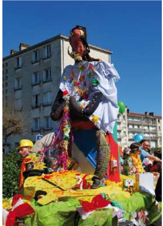
Un carnaval haut en couleur à Coulounieix-Chamiers