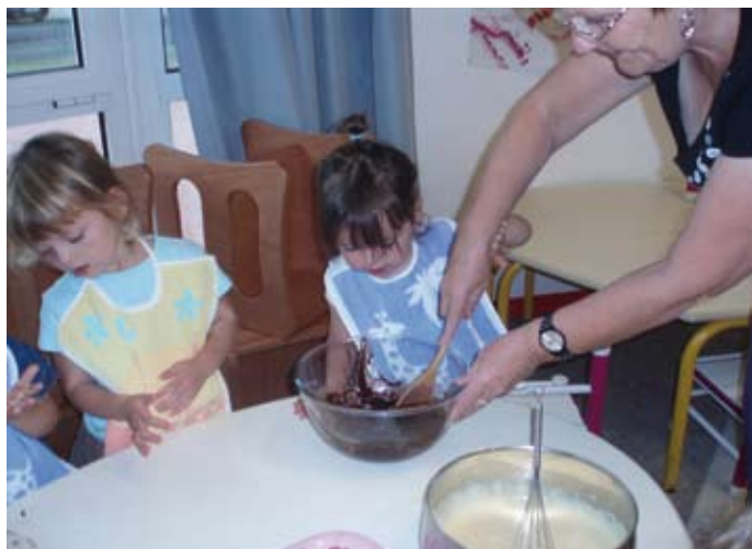
Les enfants aiment mettre la main à la pâte