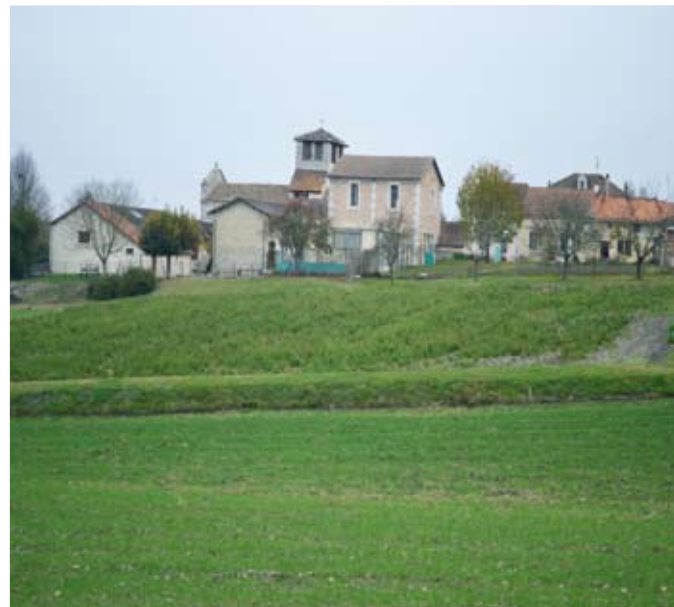
Le cadre naturel séduit à Cornille

Cornille a obtenu en 2007 la Marianne nationale et départementale du civisme avec 90,52% de votants, la classant première commune sur 6109, dans la catégorie de 501 à 1000 électeurs inscrits